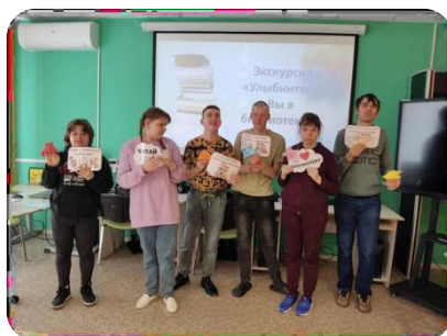
Экскурсия «Улыбнитесь, Вы в библиотеке!»