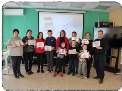
Экскурсия «Всей семьей в библиотеку»