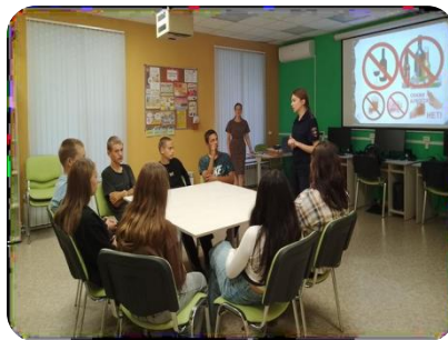
Тематическое мероприятие «Трезвость – норма жизни»