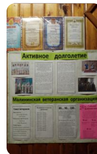
Пользователи библиотеки с ОВЗ и МГН на мероприятиях